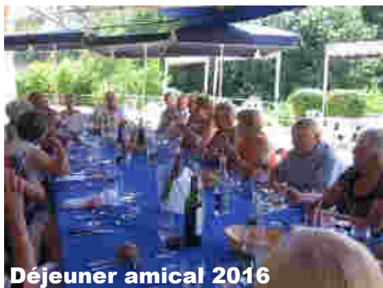
Déjeuner amical 2016

Après un déjeuner amical qui clôturait le programme d'activités du premier semestre, les adhérents se sont séparés pour les vacances.